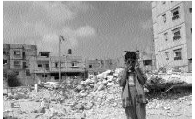
Ástandið hefur haft gífurlega slæm áhrif á börnin, kynslóðina sem á að taka við.